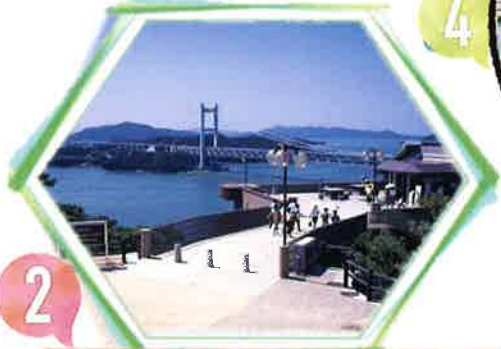
2 昼食 -瀬戸大橋を見渡せる場所で-