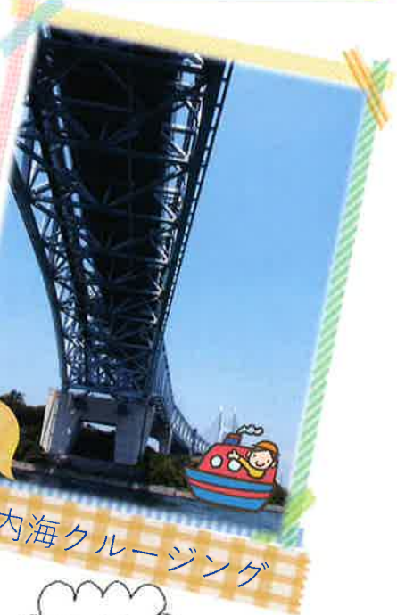
3 瀬戸内海クルージング