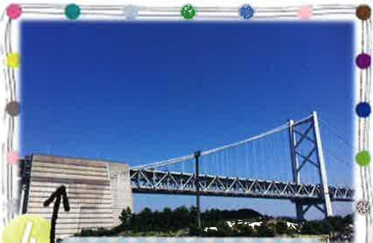
4 瀬戸大橋内部見学